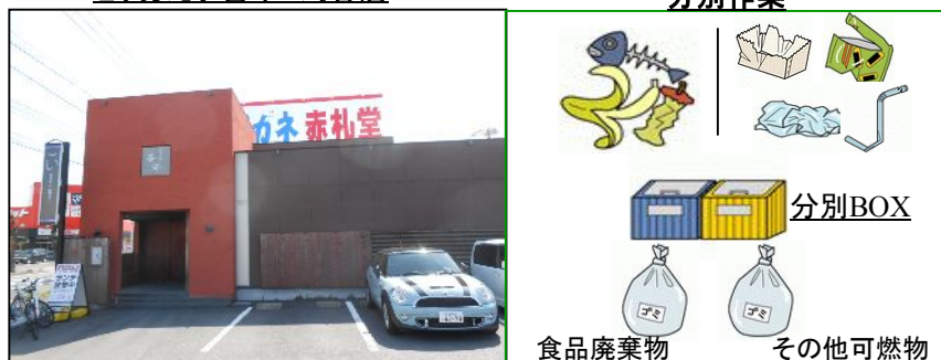
とりあえず吾平 刈谷店

まとめて廃棄していた「燃えるごみ」を 食品廃棄物 とビニール・紙等の可燃物に分別し再生利用します。ちなみに、 吾平の食品廃棄量 は10kg/日です。分別を実施することにより、食品リサイクル法の実施目標の遵守はもちろん、何が廃棄されているのか明確になり、発注抑制や食べ残し対策につなげます。